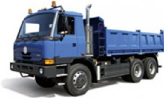
Самосвал ТАТРА 815