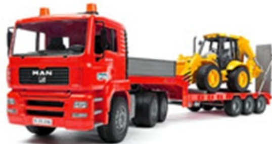
Трал 40 тонн / 60 тонн

Если вас интересует аренда самосвала с водителем или без, аренда экскаватора и профессиональное рытье котлованов, а также получение во временное пользование других транспортных средств специального назначения, в нашей компании вам будет предоставлена сравнительно недорогая аренда спецтехники – Краснодар часто обращается в при необходимости временного найма качественной и технически надежной спецтехники, всегда готовой к непростой и продолжительной работе на любых объектах.