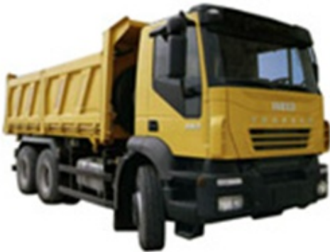
Iveco, Man (самосвалы)